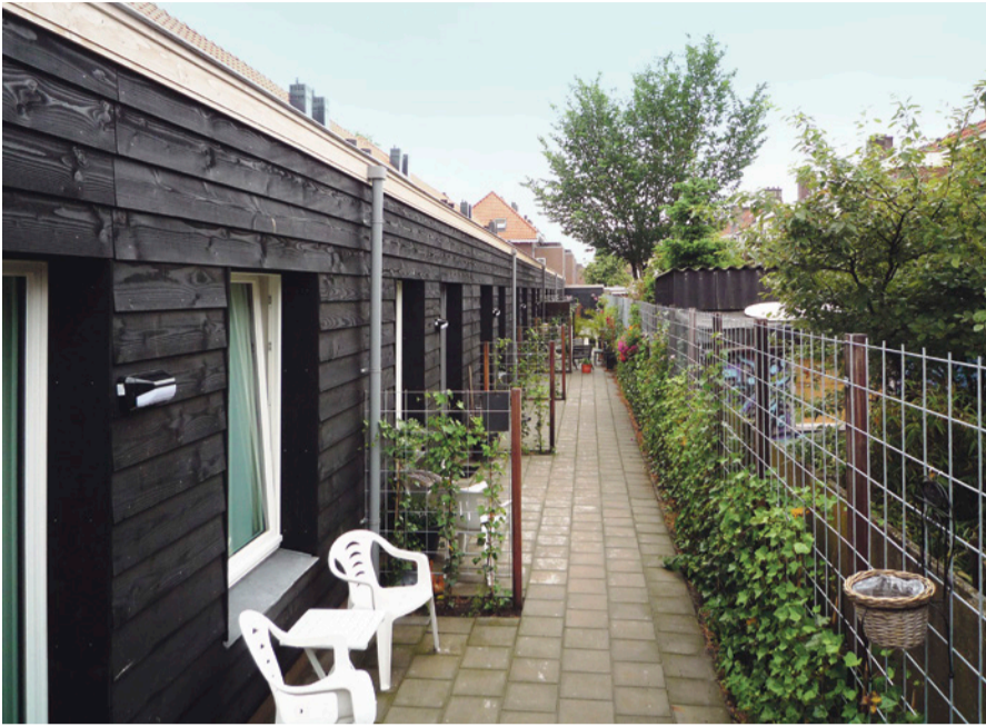
Achterzijde woningen.

mei 2012 was het startmoment voor de proefwoning, in september 2012 zijn 24 sociale huurwoningen opgeleverd en eind december 2012 waren de 8 eengezinswoningen gereed. Een jaar na de UAV-gc vraagstelling aan de markt.