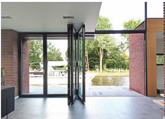
Drenpelloze vouwpui van ‘Woning aan de Vliet’ in Leiden

’s Zomers is het anders. Dan is zonwering noodzakelijk. En dan liefst een zonweringssysteem dat naar behoefte regelbaar is. Zonwerend glas voldoet niet aan die wenselijkheid. In de nabije toekomst is schakelbaar glas wellicht een uitkomst. Markiezen en zonnenschermen zijn lastig te combineren met een vouwpui die naar buiten opent. Dan zit het opgevouwen deurenpakket in de weg.