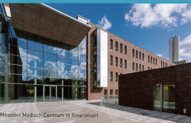
Meander Medisch Centrum te Amersfoort